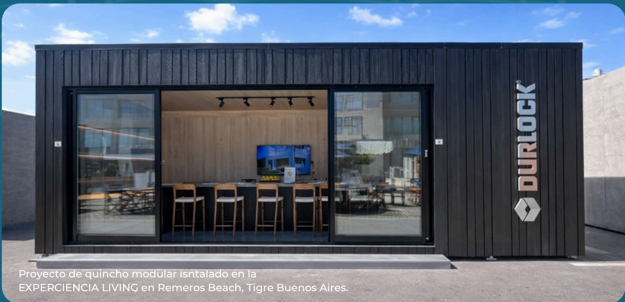
Proyecto de quincho modular instalado en la EXPERIENCIA LIVING en Remeros Beach, Tigre Buenos Aires.

Este proyecto consolida a Hábika como una solución aplicable no solo a desarrollos operativos, sino también a espacios de alto valor arquitectónico y comercial.