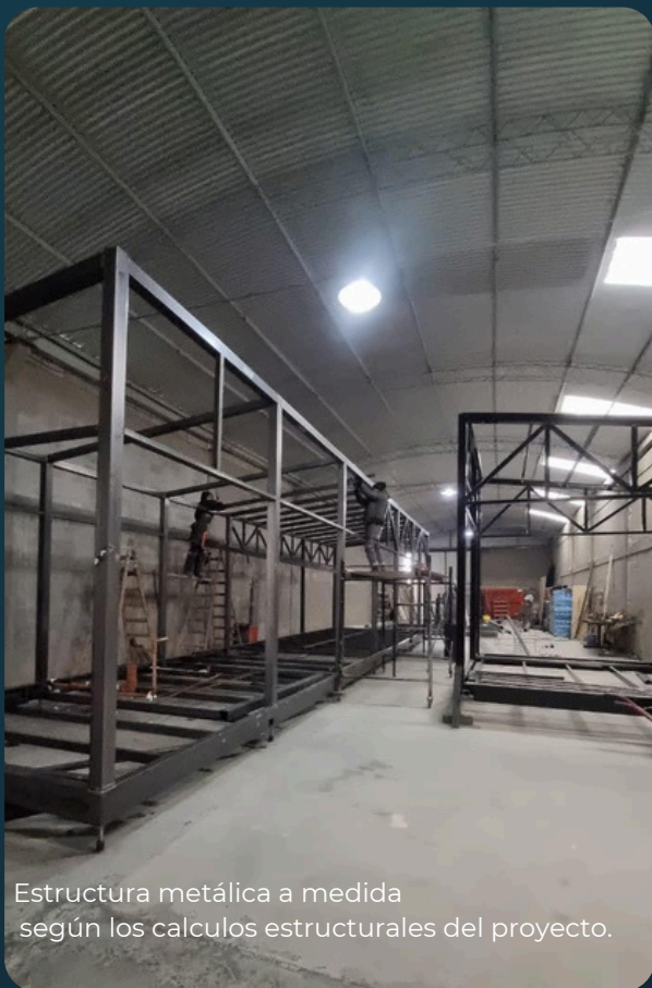
Estructura metálica a medida según los cálculos estructurales del proyecto.

Desarrollamos proyectos a medida, escalables hasta 5 plantas, adaptados a distintos usos: industriales, corporativos y comerciales.