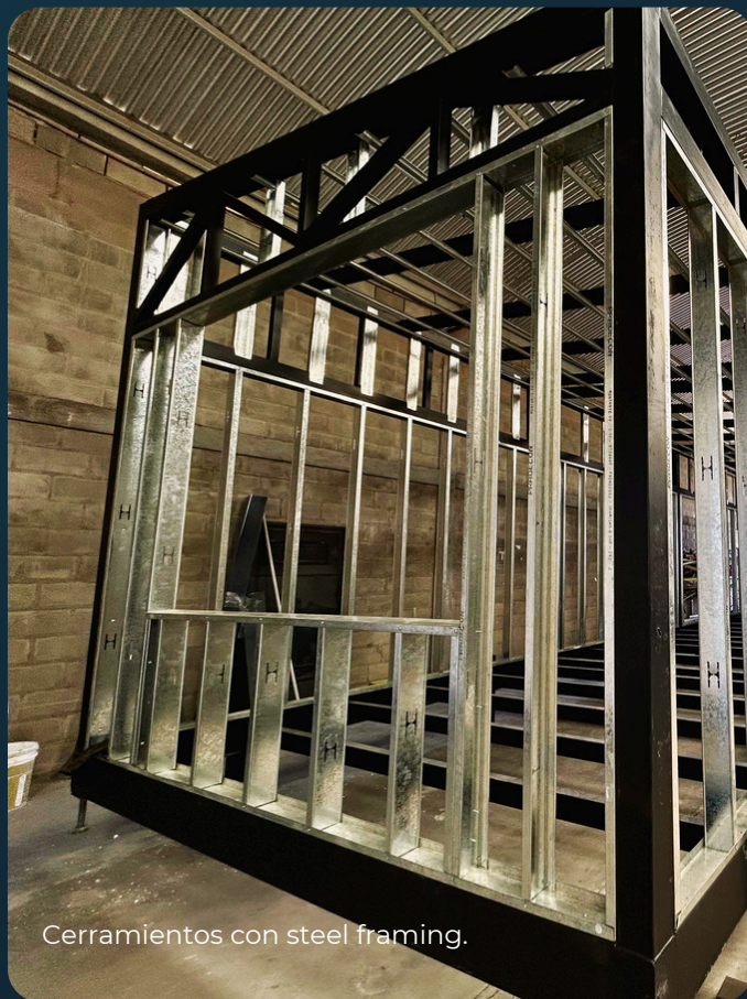
Cerramientos con steel framing.